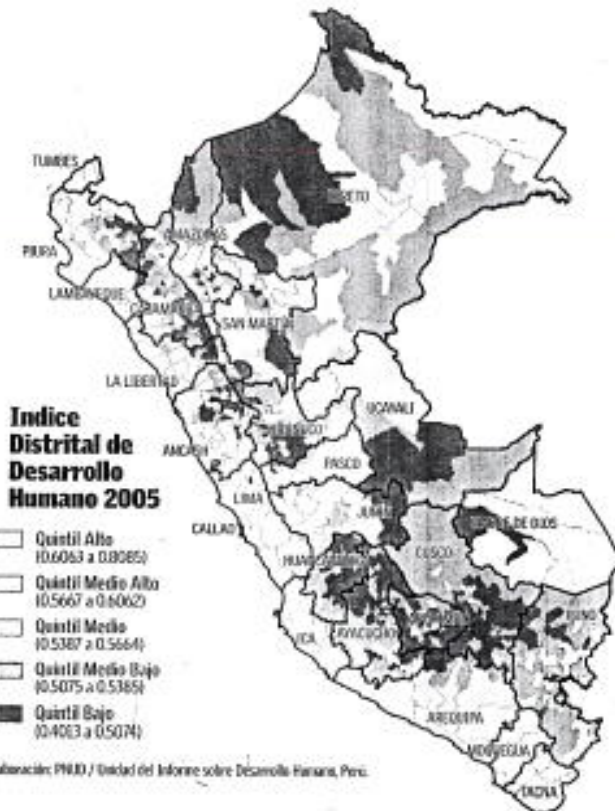
Elaboración: PNUD / Unidad de Informe sobre Desarrollo Humano, Perú.

Fuente: INEI, Censos Nacionales 2005, Censos de Población y Vivienda 2005, Encuesta de Desarrollo Humano 2005.