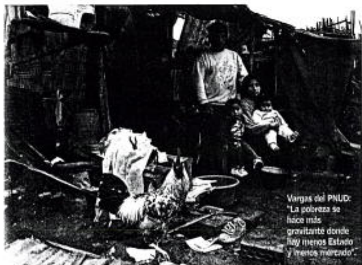
Vargas del PNUD: "La pobreza se hace más grave donde hay menos Estado y menos mercado".

Primer Ministro pone la descentralización bajo el prisma del Informe de Desarrollo Humano.